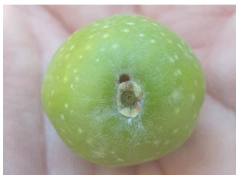
Trou de sortie de la larve de teigne.