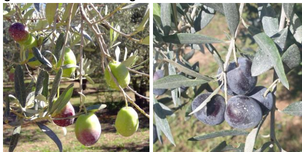
Stades BBCH 81 et 89.

Les stades phénologiques varient de 79 à 89 en fonction des secteurs. Le calibre des olives dépend entre autres de la disponibilité en eau et de la charge des arbres qui est globalement hétérogène.