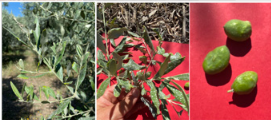
Symptômes et dégâts causés par des acariens sur olivier